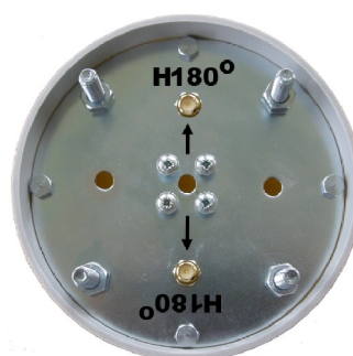
Spodní strana klastru