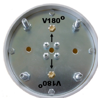
Spodní strana antény