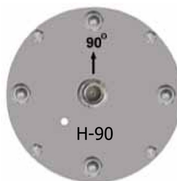
Spodní strana antény