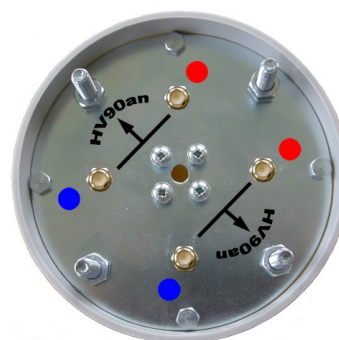
Spodní strana klastru

Zisk: 2x16 dBi Polarizace: duální (horizontální + vertikální) Impedance: 4x50 Ohm Konektor: 4x RPSMA (panelový SMA s reverzní polaritou, volitelně N-female ) Rozměry: průměr 110 x 350 mm Hlavní lalok: 2x 90° (E-rovina@-6dB) ČSV: 1,5 Vert. úhel vyzařování: 13° (V-rovina@-3dB) Pásmo: 5470 - 5725 MHz Výkon: max.1 W Hmotnost: 2,1 kg Kryt: PVC-U