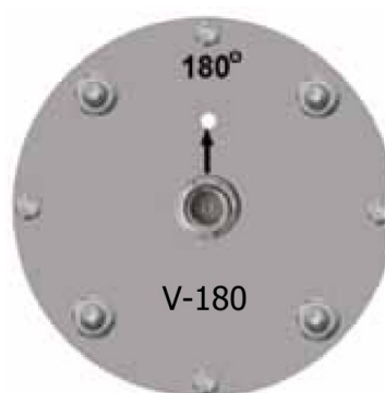
Spodní strana antény