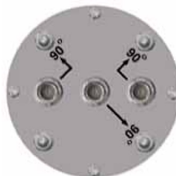
Spodní strana klastru