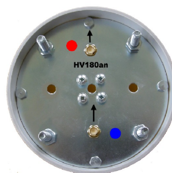
Spodní strana antény