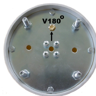
Spodní strana antény