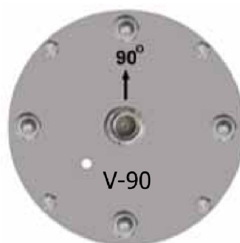
Spodní strana antény