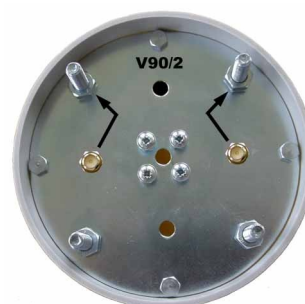
Spodní strana klastru

Zisk: 2x20 dBi Polarizace: vertikální Impedance: 2x50 Ohm Konektor: 2x RPSMA (panelový SMA s reverzní polaritou, volitelně N-female ) Rozměry: průměr 110 x 510 mm Hlavní lalok: 2x 90° (E- rovina@-6dB) ČSV: 1,5 Vert. úhel vyzařování: 11° (V- rovina@-3dB) Pásmo: 5470 - 5725 MHz Výkon: 1 W Hmotnost: 2,1 kg Kryt: PVC-U