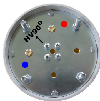
Spodní strana antény

Zisk: 1x20 dBi Polarizace: duální (horizontální + vertikální) Impedance: 2x50 Ohm Konektor: 2x RPSMA (panelový SMA s reverzní polarizací, volitelně N-female ) Rozměry: průměr 110 x 510 mm Hlavní lalok: 1x 90° (E- rovina@-6dB) ČSV: 1,5 Vert. úhel vyzařování: 11° (V- rovina@-3dB) Pásmo: 5470 - 5725 MHz Výkon: 1 W Hmotnost: 2,0 kg Kryt: PVC-U