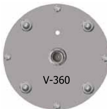
Spodní strana antény