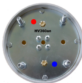
Spodní strana antény

Zisk: 14 dBi Polarizace: duální (horizontální+vertikální) Impedance: 50 Ohm Konektor: 2x RPSMA (panelový SMA s reverzní polaritou, volitelně N-female ) Rozměry: průměr 110 x 510 mm Hlavní lalok: 360° (E- rovina@-6dB) ČSV: 1,5 Vert. úhel vyzařování: 11° (V- rovina@-3dB) Pásmo: 5470 - 5725 MHz Výkon: max. 1 W Hmotnost: 3,1 kg Kryt: PVC-U